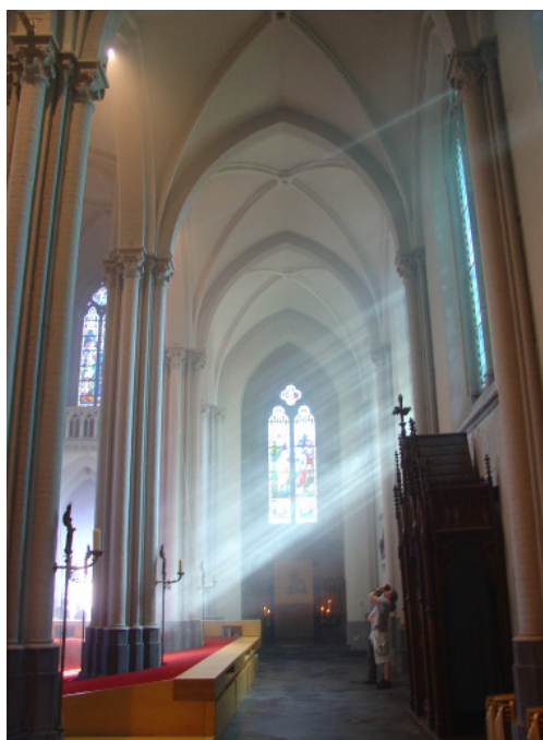
De neogotische Heilige Magdalenakerk van Brugge, de werkplaats van Yot.

Het project AGORA sluit naadloos aan bij de werking van Yot. Deze vzw situeert haar werking sinds 2002 (Brugge cultuurhoofdstad Europa) in en rond de Heilige Magdalenakerk te Brugge. Yot neemt in Vlaanderen het voortouw om experimenteel en creatief na te denken over de toekomst van de kerkgebouwen in Vlaanderen in het algemeen, maar in Brugge in het bijzonder. Die toekomst ent zich op de conviviale of agorische ruimte van het kerkgebouw. Het gebouw vindt immers zijn oorsprong en wezen in de ontwikkeling van een unieke, architecturale gemeenschapsruimte. De werking van Yot is dan ook terecht opgenomen in de al genoemde, wetenschappelijk onderbouwde publicatie over het verleden, heden en toekomst van de parochiekerken in Vlaanderen: Het open kerkgebouw (Pelckmans, 2014) van Sylvain De Bleeckere en Roel De Ridder.